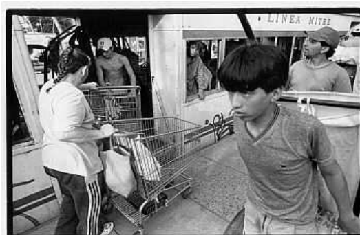
Cartoneros abordando el "Tren Blanco"