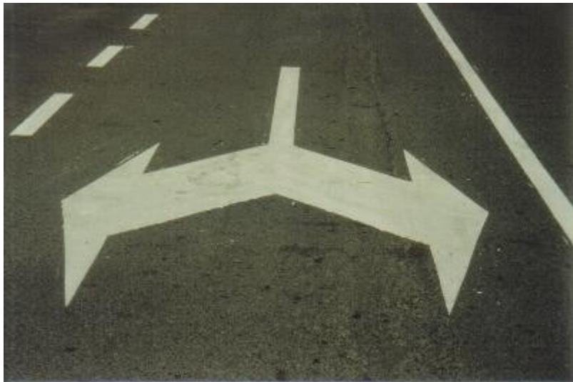
La simetría por los suelos