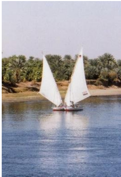
Falucas en el Nilo