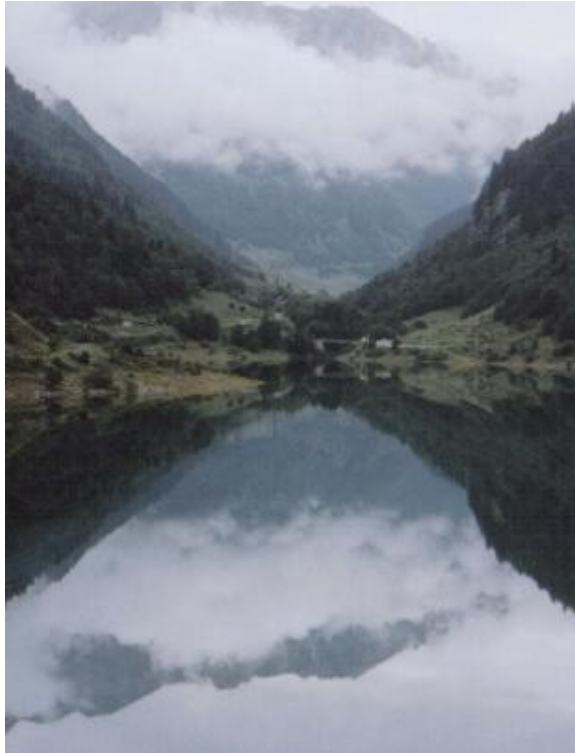
Valle de Artouste (Francia).