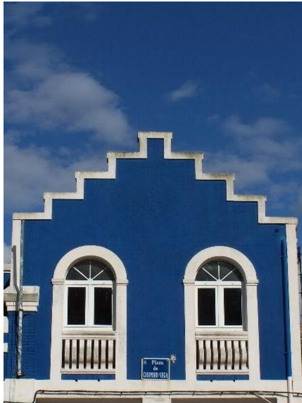
Simetría en añil - San Juan de la Arena (Asturias)