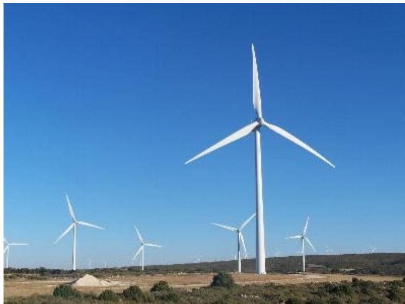
Simetría eficaz - Parque eólico en Fuendetodos (Zaragoza)