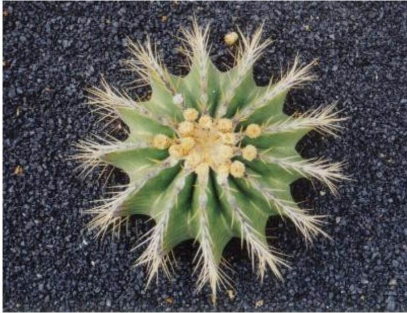
Simetría por giros de 360^\circ/13