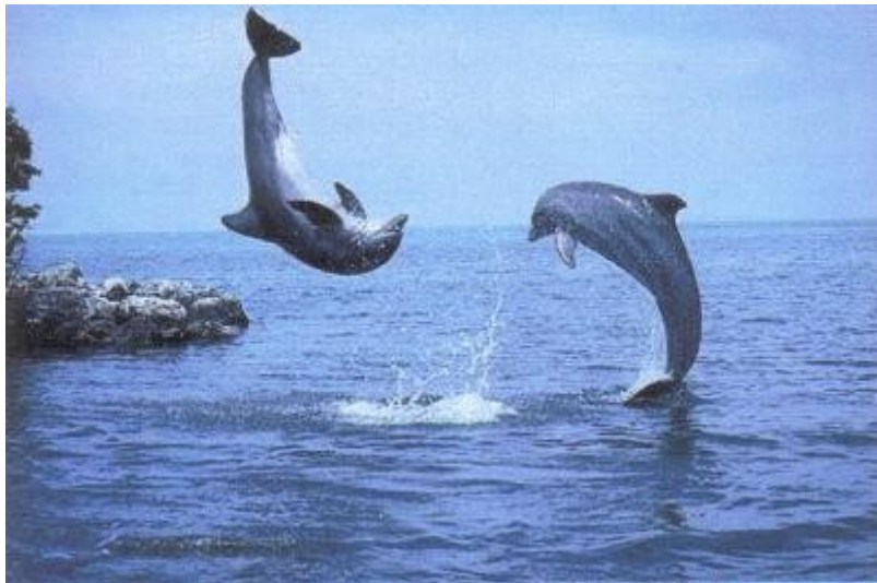
Simetría central