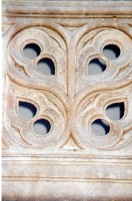
Combinación de simetrías. Palacio Fonseca. Salamanca.