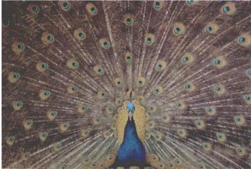
Simetria por giros de 360^\circ/14