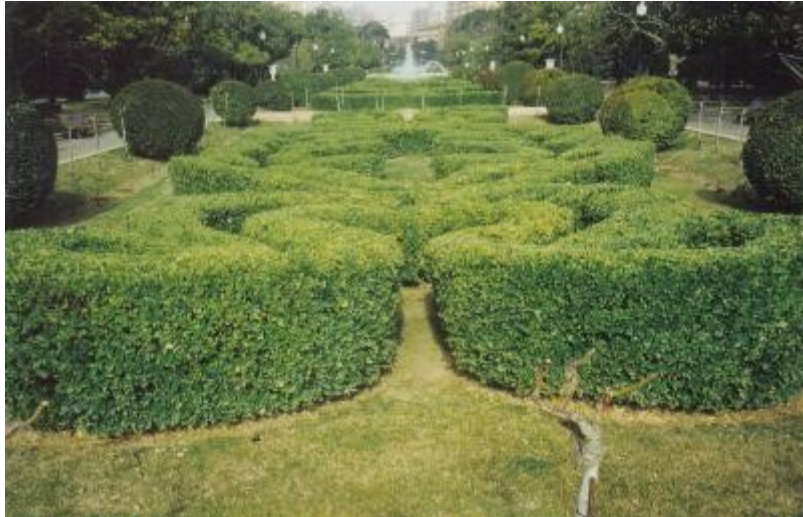
Parque Grande. Zaragoza.