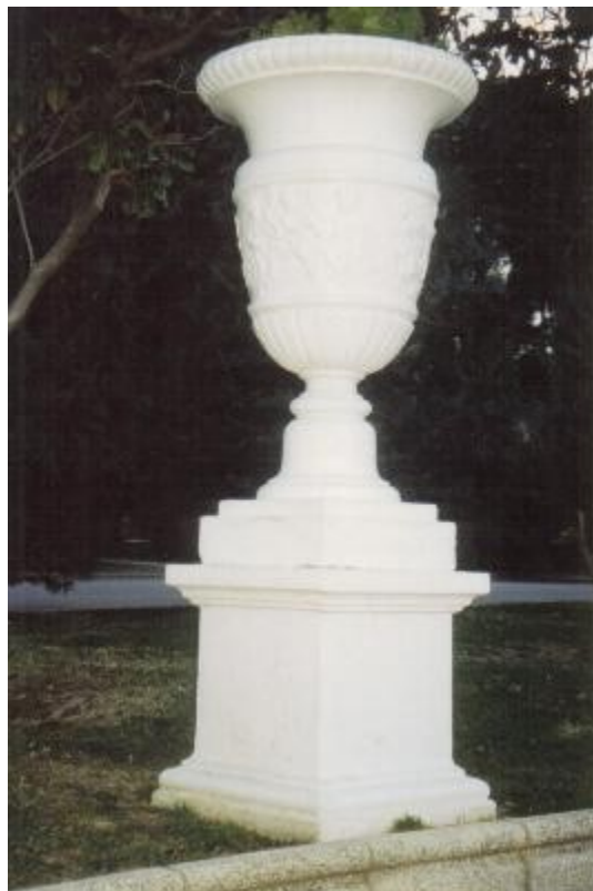
Parque Grande. Zaragoza.