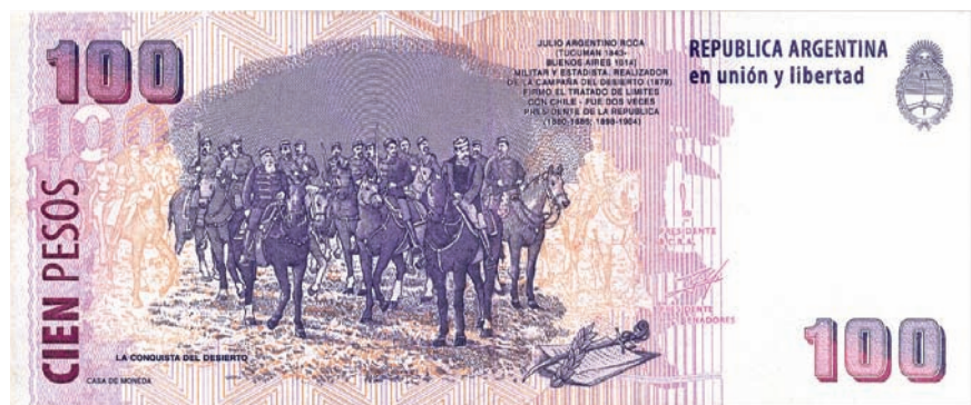
Reverso del billete de cien pesos argentinos en el que se celebra el genocidio de los aborígenes de la Patagonia bajo el nombre "La conquista del desierto".

genocidio de la llamada "Conquista del Desierto". Además, cuando se explicaban los límites nacionales, se hacía referencia a nuestros vecinos, en particular a Chile, como si fuera un enemigo con quien debemos luchar por cada centímetro de territorio. Es decir, la escuela contribuyó a conformar un conjunto de imágenes de la Argentina y de sus vecinos. En esas imágenes, la población del país aparecía como homogénea, un "crisol de razas", una mezcla de grupos diferentes. En el imaginario