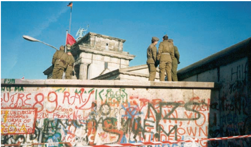
El famoso Muro de Berlín, que dividía los sectores oriental y occidental de la ciudad, construido en 1961 y finalmente derribado en 1989, al reunificarse Alemania.

Desde hace años se viene anunciando un mundo sin fronteras, una comunidad global donde las interconexiones entre ciudadanos muy distantes fluyen sin barreras, donde los productos y las personas se transportan, donde las informaciones y los mensajes viajan aunque la gente permanezca en su sitio. Se trata de un antiguo pronóstico, el augurio de una aldea global donde no se compartirá el fogón de las leyendas, sino los mitos de la televisión. Ya sea por el desarrollo de las tecnologías, ya sea por la expansión de poderes militares y coloniales, ya sea por la velocidad de los flujos de capital, una y otra vez se anuncia el fin de las fronteras. En las próximas páginas veremos que esa afirmación no tiene correspondencia con lo que está sucediendo en el mundo y que asumir esa creencia equivocada, además del error de diagnóstico, impone un fuerte límite a la imaginación social.