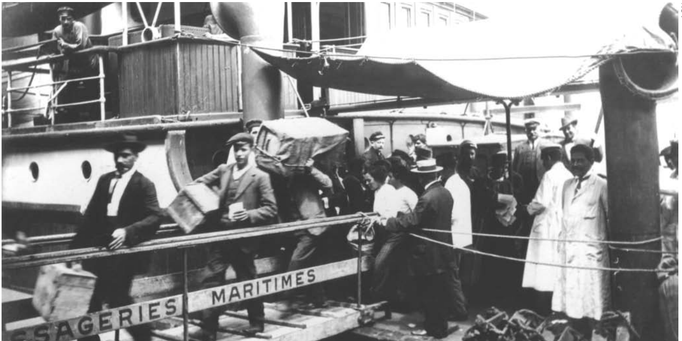
Llegada de inmigrantes europeos al puerto de Buenos Aires a comienzos del siglo XX.

Los Estados nacionales, en todo el mundo, son fenómenos bastante recientes. Hace 150 años no existían Italia o Alemania. En América Latina hace poco menos de dos siglos, cuando se iniciaba el proceso de las independencias, no había sentimientos nacionales. Los sentimientos e identidades nacionales fueron construidos socialmente en procesos complejos que incluían la consolidación de instituciones, leyes, derechos y acceso a beneficios ciudadanos.