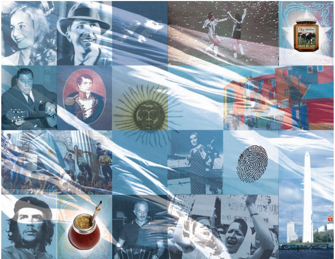
Diversos iconos de la llamada "cultura nacional" argentina.

que los elementos compartidos no deben buscarse entre supuestos rasgos culturales objetivos, sino en las experiencias históricas y en las creencias y prácticas que esa experiencia genera.