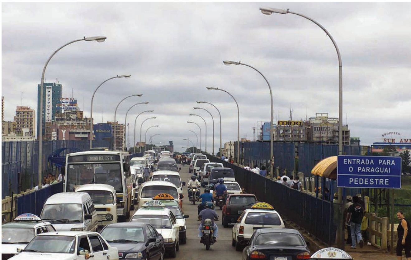
Marcio Fernandes / AE

Para complicar más las cosas, en el contexto del Mercosur se han construido y se siguen construyendo puentes que, según