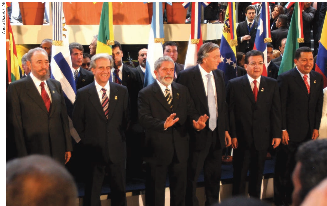
El Mercosur nació como una unión aduanera entre Argentina, Brasil, Paraguay y Uruguay. En 2006 comenzó el proceso de incorporación de Venezuela, se impulsó la integración de Bolivia y se establecieron acuerdos comerciales con Cuba.

La tensión entre naciones, diversidad e integración regional se ha planteado desde el principio en el Mercosur. En la etapa anterior, aquella de las hipótesis de conflicto bélico, la nación dominaba el conjunto del panorama, subordinando la diversidad e inviabilizando un proyecto regional. Desde que