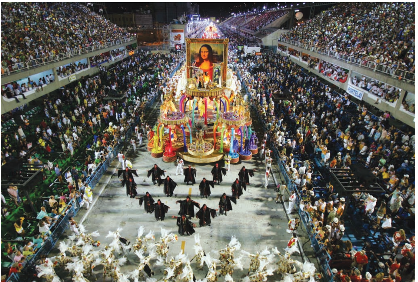
El carnaval de Río de Janeiro, Brasil: desfile de escuelas do samba por el sambódromo, símbolo de la institucionalización del Carnaval.