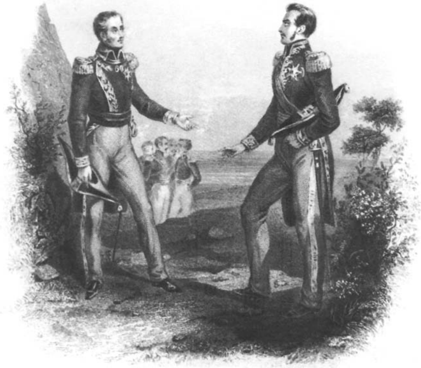
Simón Bolívar y José de San Martín, libertadores de América y héroes de la emancipación latinoamericana.

La globalización, al acortar las distancias espacio-temporales, produce un incremento cualitativo de las interacciones entre gru-