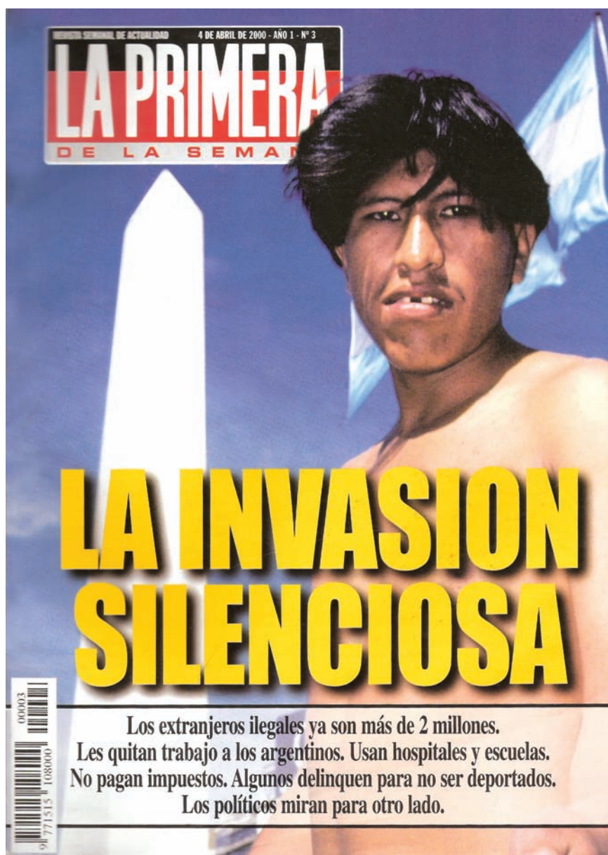
La xenofobia en la Argentina, alentada desde los medios masivos de comunicación.

Los proyectos de integración regional impulsan la liberalización del mercado de capitales, apuntando al desarrollo de una economía de escala. En cambio, no se ha avanzado en facilidades para el desplazamiento de trabajadores en el área del Cono Sur.