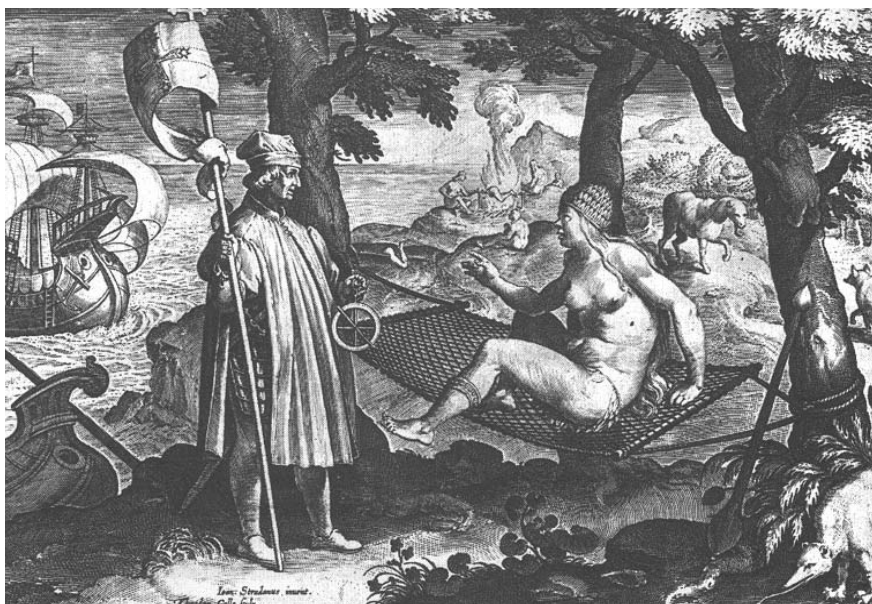
Representación de América como mujer desnuda y exuberante ante una Europa masculina, vestida y conquistadora en un grabado de Jan van der Straet (siglo XVI).

Las imágenes siempre tienen un componente imaginario, que se encuentra incluso en la misma palabra imagen. En el caso que nos ocupa –la construcción de América Latina– intervienen al menos dos componentes, que ya pueden ser reconocidos en el término "América Latina". Se trata de un encuentro (algunos prefieren llamarlo enfrentamiento) entre Europa y América, entre el Viejo y el Nuevo Mundo, en el que, salvo excepciones, estuvo ausente el diálogo. Los europeos, al llegar al territorio americano, impusieron sobre él un conjunto de creencias y formas de organización colectiva y lo nombraron de acuerdo con sus propias expectativas, que incluían la llegada al continente asiático, la difusión de la religión católica y la búsqueda de riquezas materiales. Las primeras percepciones registradas en el diario de Colón hablan de una imagen edénica, en la que América se presenta como una visión del Paraíso y en la que los indios parecen seres de una pureza celestial. Pero ante todo habría que pensar en la imagen como una codificación, esto es, una representación que se fija en la memoria colectiva, es reproducida en momentos sucesivos, en libros y relatos, en representaciones pictóricas o, incluso, en fotografías, y adquiere así un lugar persistente en la cultura.