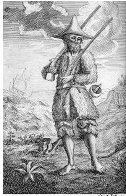
Ilustración de la primera edición de Robinson Crusoe (1719).

Si bien es cierto, como señala Mary Louise Pratt, que en los dos libros recién mencionados el científico destaca el contraste entre Nueva España —México—, donde culmina su travesía latinoamericana y en donde encuentra una sociedad culta y sofisticada, y Sudamérica, de donde llegaba y en donde ve escasos vestigios de civilización, resulta necesario destacar una oposición más significativa presente en su obra: la que enfrenta los hemisferios anglosajón y latino del continente americano. Dice en el capítulo XXVI de su Narración personal ...: "Resulta, pues, que si en las investigaciones de economía política, se acostumbra a no considerar sino masas, no se podría desconocer que el continente americano no está repartido, hablando propiamente, más que entre tres grandes naciones de raza inglesa, española y portuguesa". Y un poco más adelante: "Hoy, por la parte continental del Nuevo Mundo se encuentra como repartida entre tres pueblos de origen europeo: uno, y el más poderoso, es de raza germánica; los otros