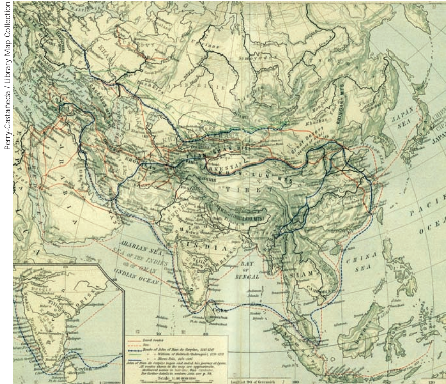
Marco Polo (1254-1324) atravesó Asia y estuvo en la corte de Kublai Khan durante diecisiete años. El relato de sus viajes maravilló a los europeos e impulsó a varios exploradores a adentrarse en territorios desconocidos para Europa.

La literatura de viajes, desde los relatos de Marco Polo hasta los de los cronistas de guerra contemporáneos, cumple una función central para definir la identidad colectiva. Un libro de viajes habla de una sociedad, la describe y presenta una imagen de ella para un público que por lo general la desconoce. El viajero funciona como intermediario entre dos espacios opuestos, a los que conecta entre sí: recorre un territorio desconocido, escribe sobre lo que ve y lo transmite a un lector distante, con el que comparte un código (lingüístico, pero también cultural) y con quien crea una complicidad frente a esa cultura extraña que describe. El viajero siempre se parece a un espía: observa y anota, acumula información sobre una sociedad lejana y la transmite a un público culturalmente próximo y geográficamente remoto, que ignora cómo es esa cultura y siente curiosidad por conocerla.