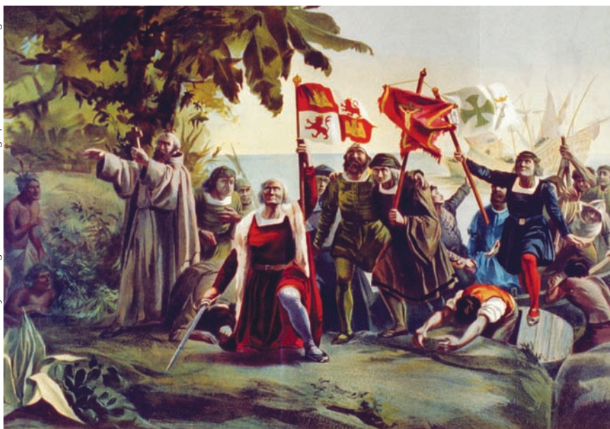
Llegada de Colón a América, según una litografía de 1892.

Nos han llegado escasos y fragmentarios testimonios de los escritos de Cristóbal Colón. La mayoría de ellos se perdieron. Sin embargo, lo poco que tenemos, partes de su diario transcritas por el sacerdote Bartolomé de Las Casas en su Historia de las Indias , algunas cartas a los reyes y otras piezas de su correspondencia, nos permite reconocer un momento fascinante de la historia de América, el punto en el que la misma idea del Nuevo Mundo aparece en la conciencia europea. La primera reacción de los viajeros fue suponer, debido a la extrema belleza del lugar donde se encontraban, que estaban en el Paraíso terrenal. Veamos, por ejemplo, un fragmento del diario del 16 de octubre de 1492, cuatro días después de la llegada a América. Dice allí Colón: