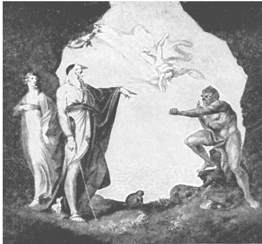
Próspero enfrenta a Calibán, símbolo de América en La tempestad , de Shakespeare.

No obstante, la visión de los Estados Unidos como lo opuesto y amenazante, un destino temible y evitable, predominó entre los escritores latinoamericanos. El autor paradigmático