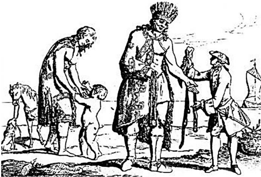
Los "gigantes" patagones según un grabado europeo del siglo XVIII.

D urante el siglo XVIII tuvo lugar en Europa una severa lectura de la realidad americana. La idealización del Nuevo Mundo que predominó durante la primera etapa de la conquista fue reemplazada por una imagen mucho menos feliz, aunque igualmente deformada, que asociaba el nuevo continente, precisamente por su condición