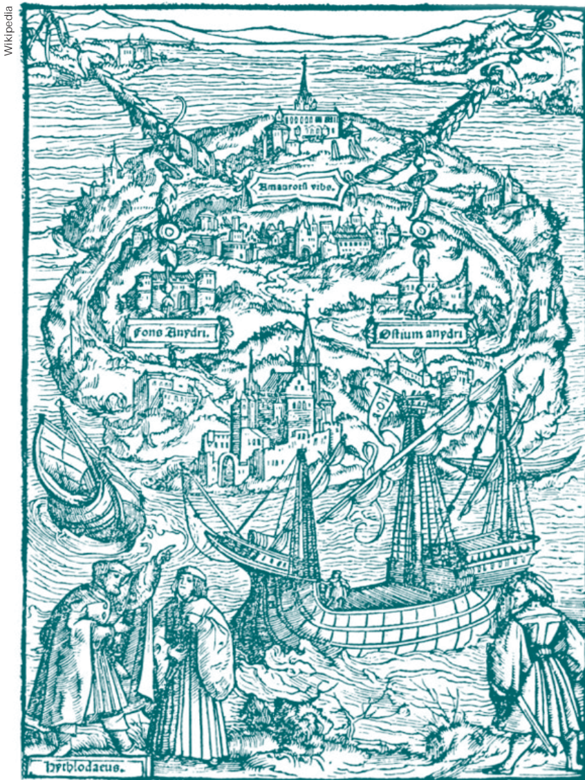
Representación de la isla de Utopía, la sociedad perfecta que diseñó Tomás Moro a comienzos del siglo XVI.

Por último, en la época actual, la noción de América Latina comienza a disolverse. La presencia cada vez más importante de latinoamericanos en los Estados Unidos inte-