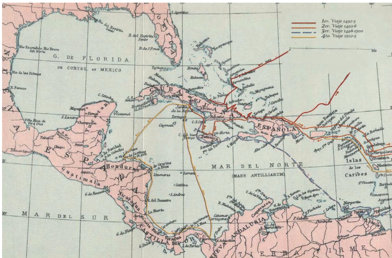
Recorrido por las costas americanas de Cristóbal Colón en sus cuatro viajes.

Es decir que América nace a partir de una relación estrecha con la cultura europea, una relación donde no están ausentes la tensión y la violencia, y que se manifiesta en especial en el dominio de la cultura y la imaginación. En este sentido, al expandir el dominio europeo sobre América, escribir es nombrar: atribuir designaciones y nombres —como el mismo término "América"— es un mecanismo de apropiación y anexión. Según veremos, esta política aparece con bastante claridad y conciencia en el propio Colón.