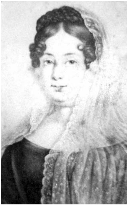
Francisca Javiera Carrera cumplió un importante papel en el proceso de independencia chileno.

Otro ejemplo es la colombiana Polonia Salvatierra y Ríos; conocida bajo el seudónimo de Policarpa, actuó como enlace de los revolucionarios en el período de la reconquista española, enviando mensajes anticoloniales camuflados en naranjas. Descubierta su actividad de espionaje y contraespionaje por los realistas, fue fusilada el 10 de noviembre de 1817, poco antes de la llegada del ejército libertador comandado por Simón Bolívar a Bogotá.