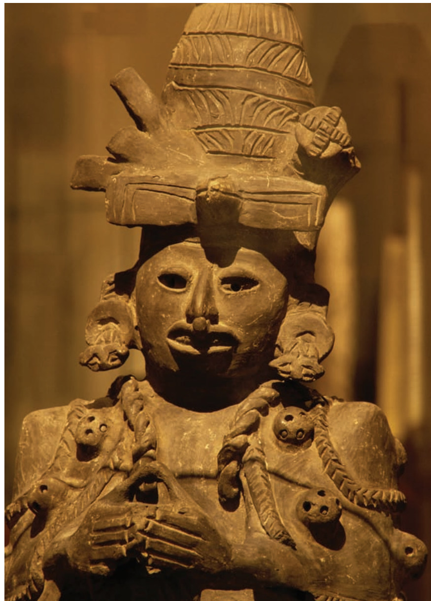
Representación de una mujer en una cerámica precolombina.

En América, se produjo la circulación de mujeres entre diferentes grupos como una necesidad para asegurar la reproducción de la comunidad y esta práctica, a su vez, sentó las bases objetivas del inicio de la opresión de las mujeres. Por otra parte, los primeros