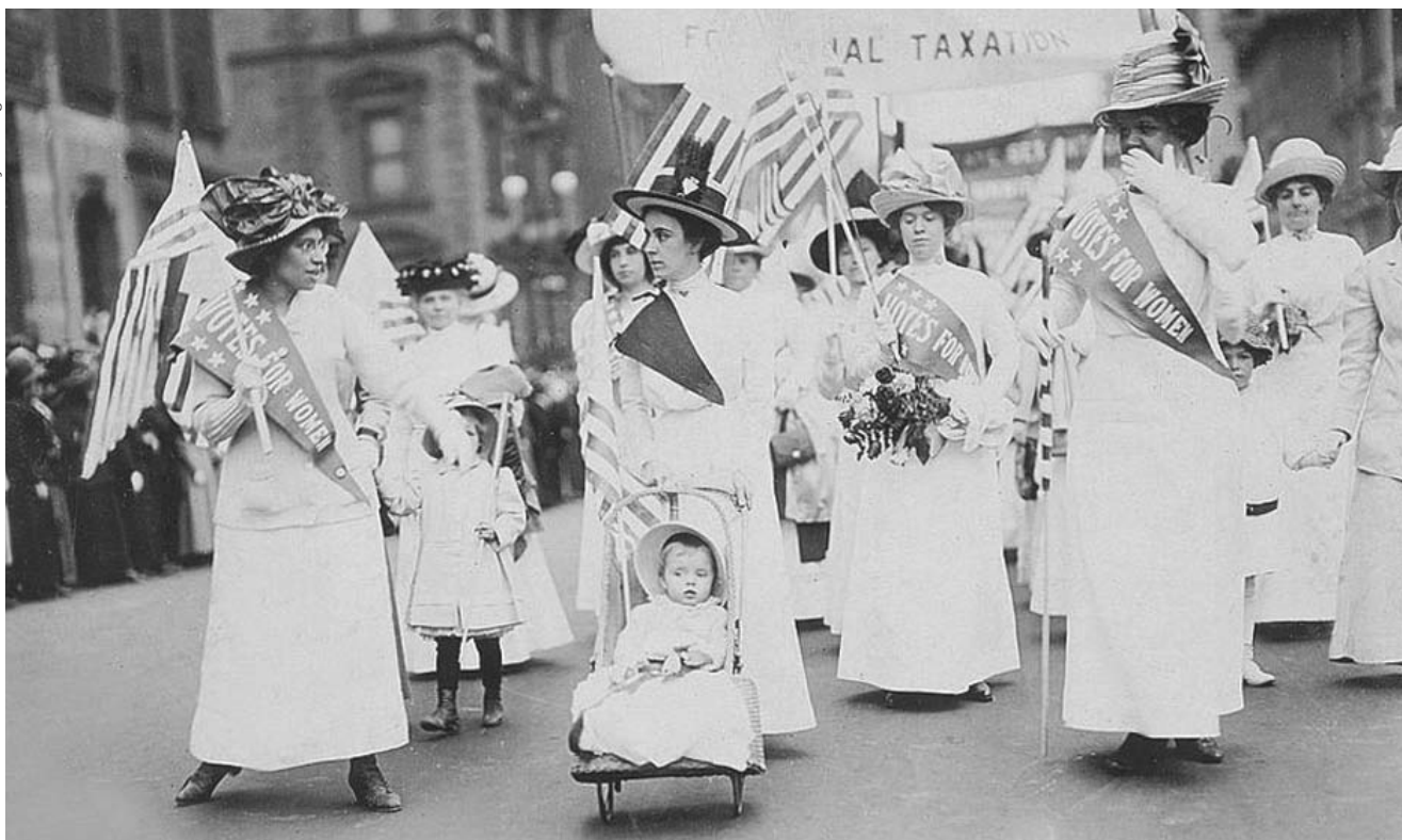
Los movimientos sufragistas en América Latina fueron simultáneos a los de Europa y Estados Unidos. En la foto, mujeres sufragistas marchan por las calles de Nueva York, en 1912.

Quedé muerto como mineral y me convertí en planta.