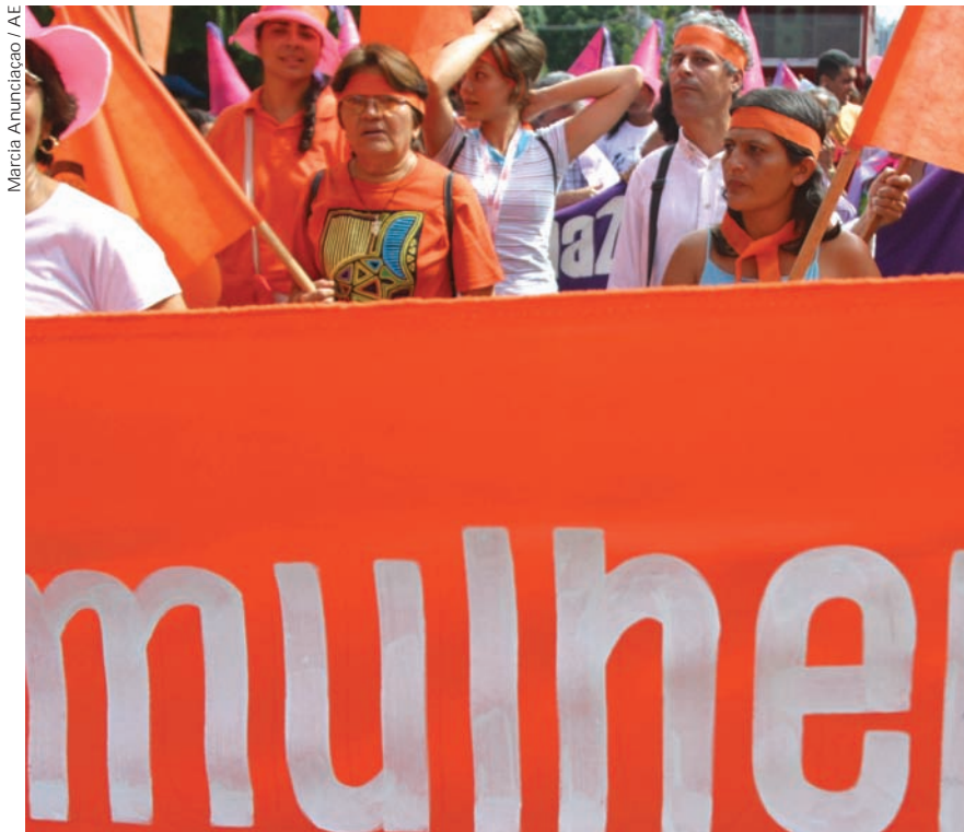
En 2005, hombres y mujeres marchan por las calles de Brasil en conmemoración del Día Internacional de la Mujer.

Algún día habrá muchachas y mujeres cuyo nombre no significará ya sólo un opuesto de lo masculino sino algo en sí mismo, algo que no haga pensar en complemento y límite, sino solamente en vida y existencia: el ser humano femenino.