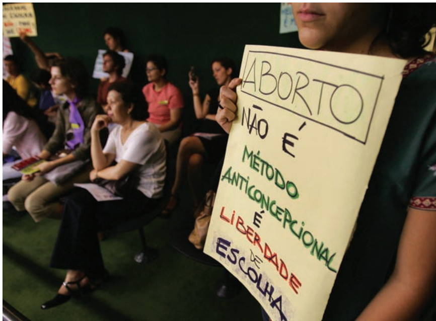
Acto en favor de la despenalización del aborto en Brasil.

mujeres en puestos de dirección, y los recortes de personal siempre empiezan por ellas. Incluso la desocupación es visibilizada en forma muy diferente entre varones y mujeres. Aunque muchas mujeres son el verdadero sostén económico de las familias, siempre se considera que el varón debe proporcionar el sustento familiar y, en tal sentido, la pérdida del trabajo es tomada en forma claramente diferente por uno y otro género.