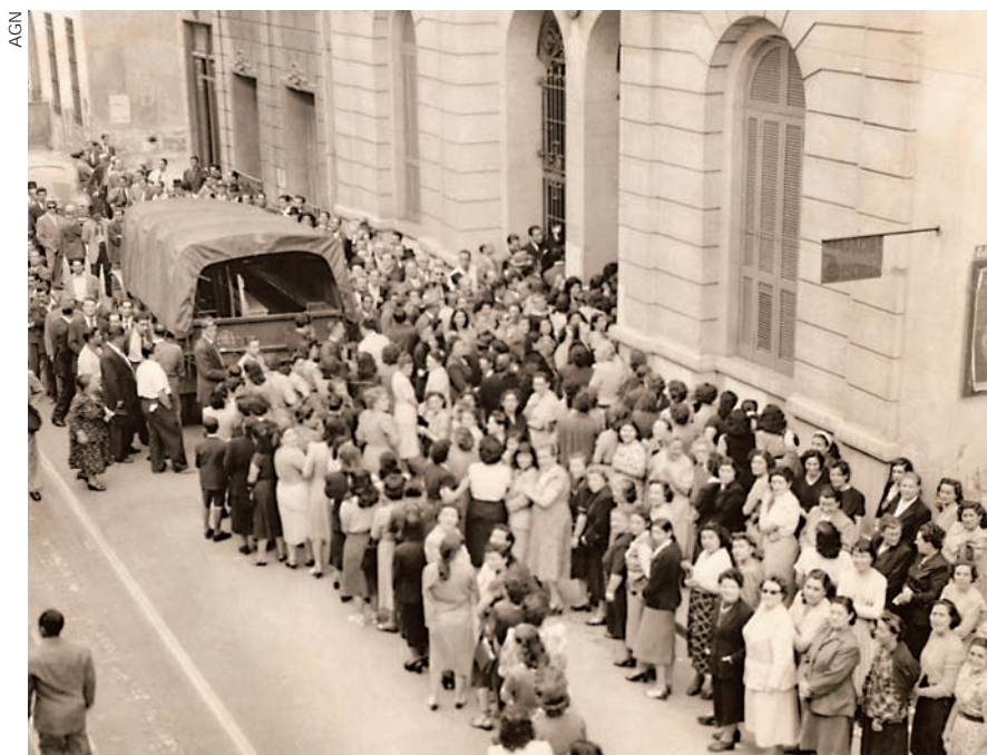
Cola en el frente de un centro de votación durante las primeras elecciones argentinas en las que las mujeres pudieron votar, 11 de noviembre de 1951.

zada y las mujeres debieron seguir luchando hasta 1951 para poder votar.