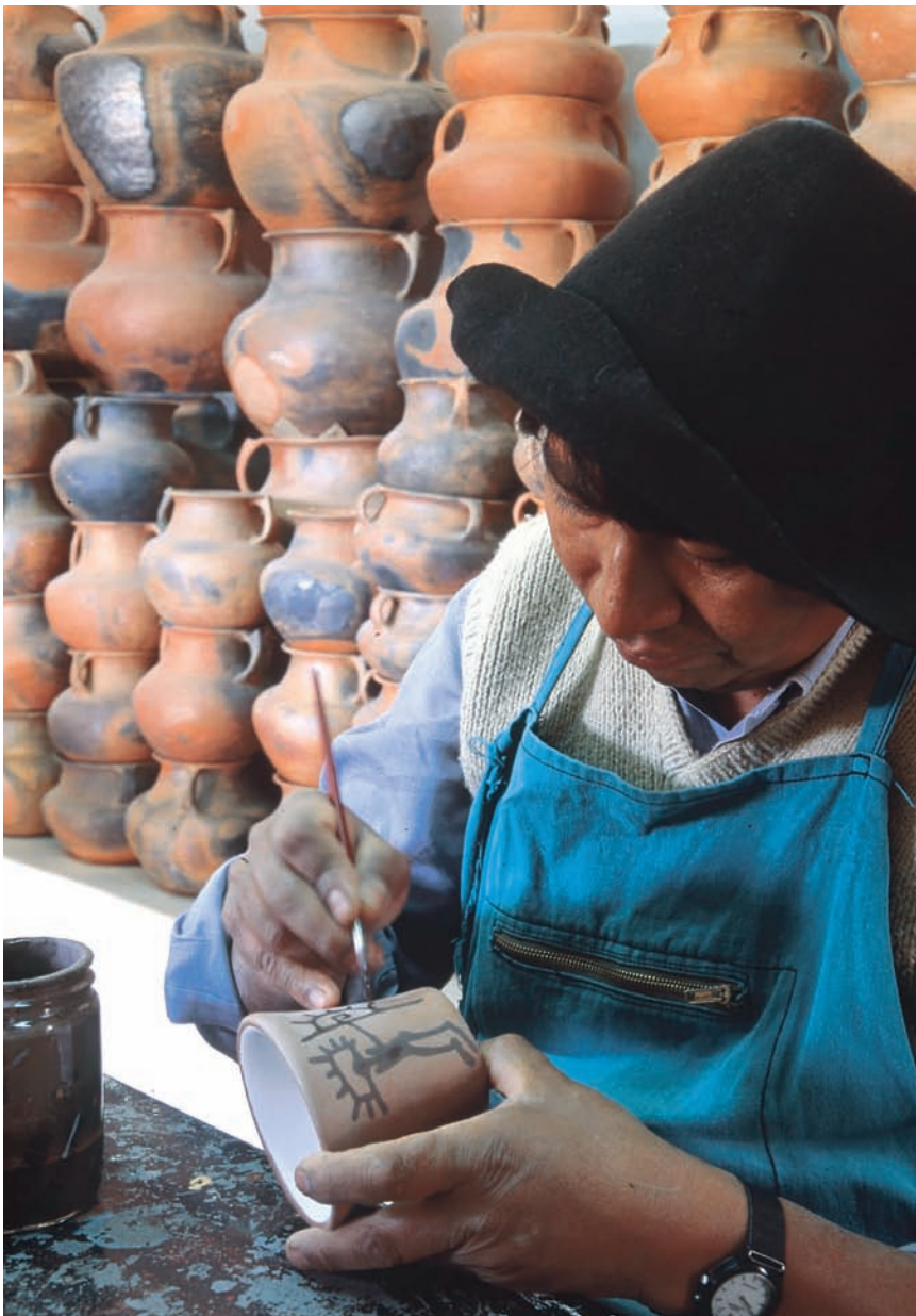
Mujer realizando trabajos de cerámica en el norte argentino.

síntomas de dominación los advertimos en la división sexual del trabajo. Hay que tener presente que este primer sometimiento, anterior a la propiedad y al surgimiento del Estado, no fue el resultado directo de su condición de reproductora de la vida, sino impuesta por la dominación de un sexo sobre otro, donde la fuerza física debe haber jugado un papel importante. Incluso para el grupo de varones dominadores funcionó como una práctica para implementar el sometimiento sobre otros grupos foráneos de la comunidad primitiva.