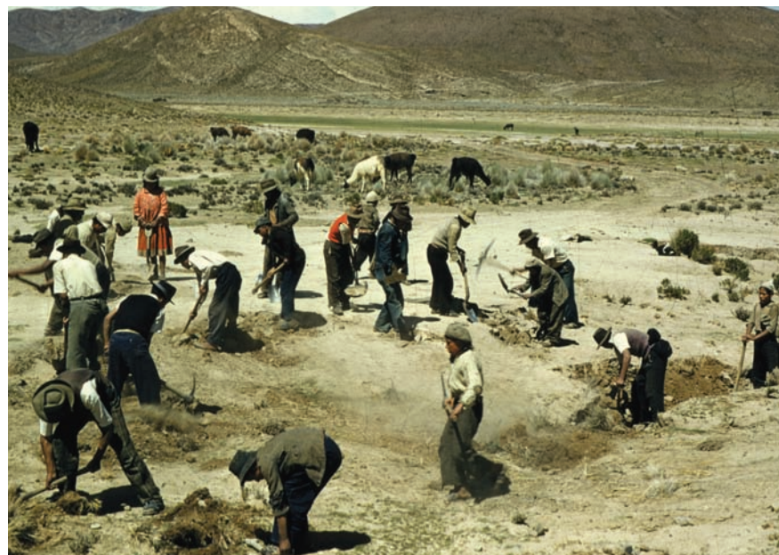
Mujeres y hombres, sin distinción de género en las tareas, preparan un terreno para la labor agrícola en Bolivia.

En el nivel de organización se formaron grupos autónomos de mujeres que pronto chocaron con la estructura partidaria, por derechas y por izquierdas, que de manera antidemocrática se negaba a aceptar el derecho de "las demás" a la autonomía.