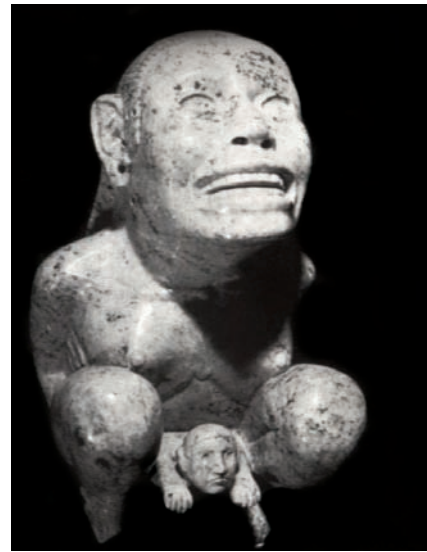
Tlazolteotl, diosa azteca de la fertilidad y la procreación (entre otros atributos) (ca. 1300-1500).

No obstante el acelerado proceso que llevó hacia el patriarcado en los imperios incas y aztecas, las mujeres todavía mantuvieron roles importantes en estas culturas, aunque las urgencias de mano de obra del imperio colisionaban con las tradicionales necesidades de las mujeres en las comunidades base. En relación inversa, mientras más aumentaba la producción social y el poder público, la participación y autoridad de las mujeres se reducía. Pese a esta situación de creciente sometimiento, no podemos dejar de señalar que, aun bajo los incas y los aztecas, las mujeres conservaban más relevancia social que sus contemporáneas de la sociedad feudal europea.