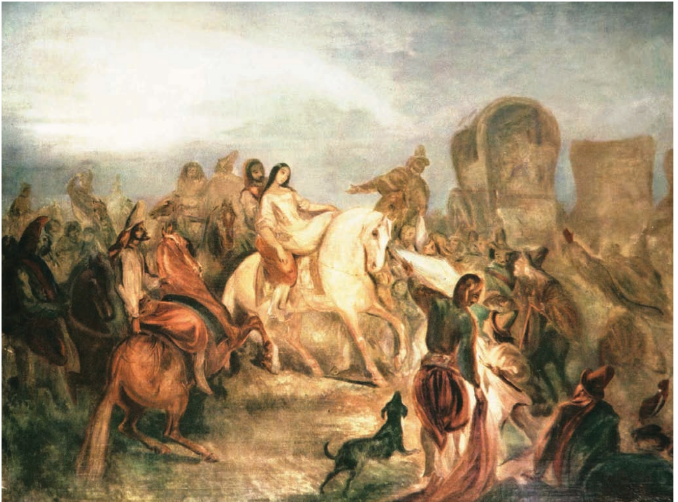
El regreso de la cautiva, obra de Juan Mauricio Rugendas (1845).