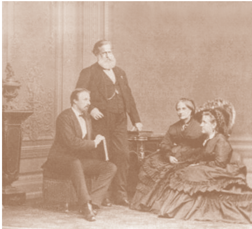
Pedro II, emperador de Brasil entre 1831 y 1889.

El largo y tortuoso proceso de construcción de los Estados y las sociedades latinoamericanas posterga y/o resignifica el ideal de la democracia política. Es decir, se establece el principio de la soberanía residiendo en la nación (más que en el pueblo), la división tripartita de los poderes, la forma representativa, incluso el sufragio universal