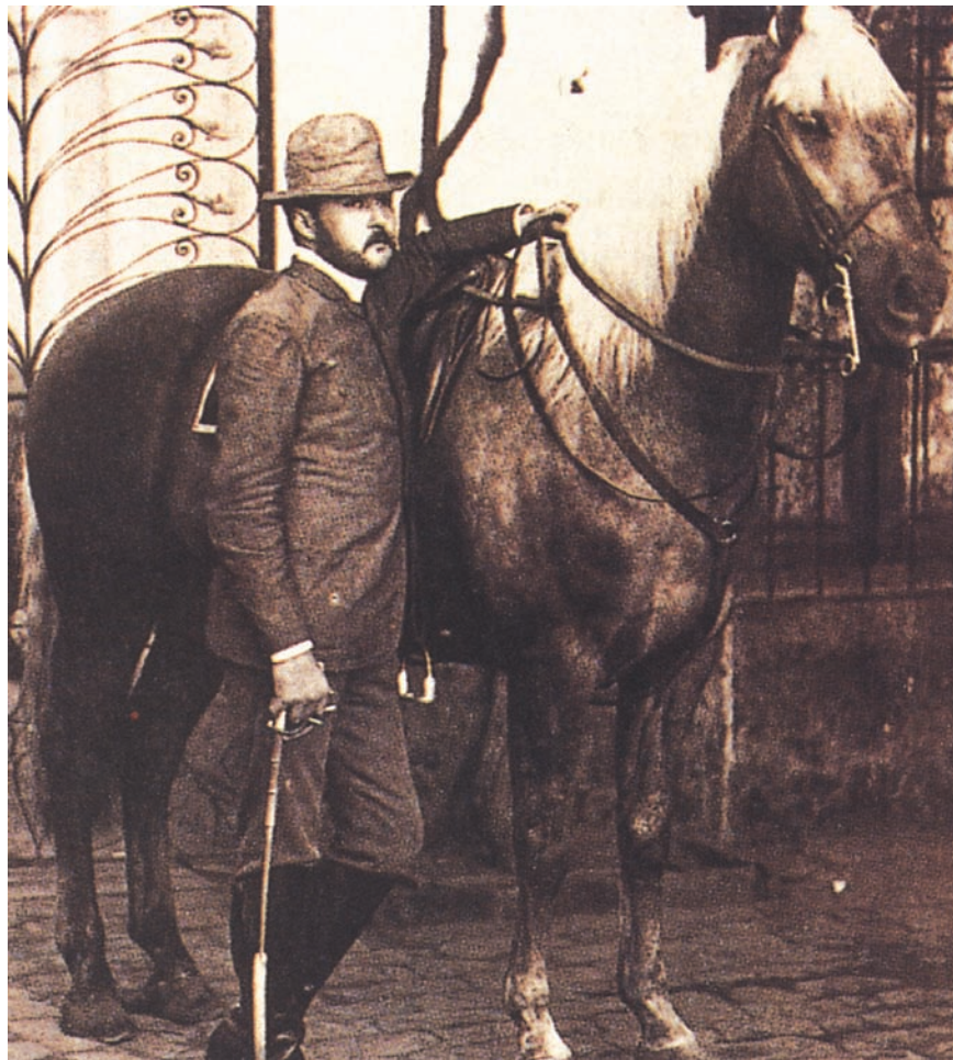
Estanciero de la provincia de Buenos Aires de fines del siglo XIX.

mengua de coexistencias en ambas dimensiones. La plantación surge a comienzos del siglo XVI; la hacienda, a principios del siglo XVII, y la estancia, a fines del siglo XVIII. La primera se encuentra en el Caribe (Antillas mayores y menores, parte del litoral del golfo de México, costas de Belice, costas y valles aledaños de Venezuela), el nordeste brasileño (y luego las áreas cafetaleras, hacia el centro sur del país), las Guayanas, partes de Colombia y la costa de Perú, y persiste hasta la abolición de la esclavitud, durante el siglo XIX. La hacienda abarca una superficie mayor, desde México hasta el noroeste argentino y Chile central, especialmente en las áreas andinas; su notable capacidad de adaptación a las transforma-