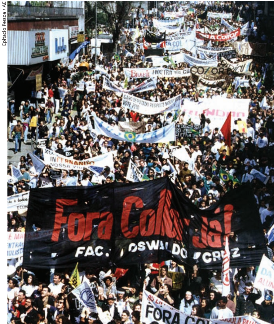
Epitacio Pessoa