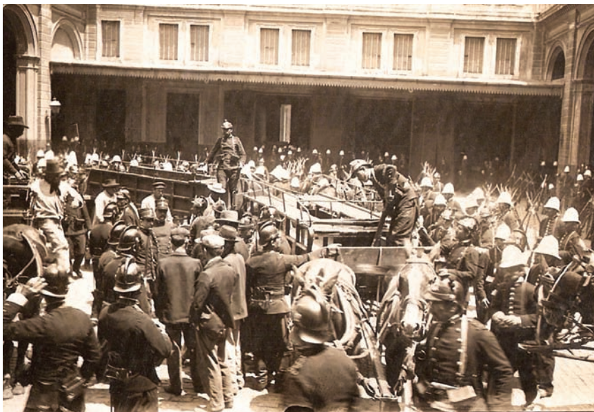
El levantamiento cívico-militar de la Unión Cívica, conocido como Revolución del Parque (1890), apelaba a una democratización del régimen político. Si bien fue sofocado, provocó la caída del presidente Juárez Celman.