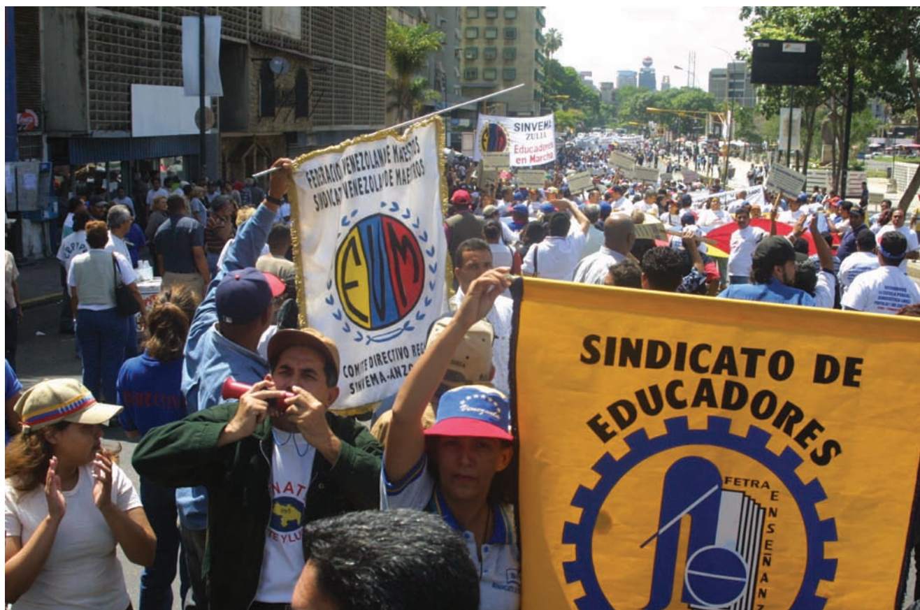
Manifestantes en el golpe de Estado fallido contra el presidente de Venezuela, Hugo Chávez, en abril de 2002.

La historia de la región muestra que, por distintas razones, tanto las clases subalternas —proletarios, trabajadores, campesinos, las clases medias urbanas—, como las clases propietarias (sean burguesías o no) no siempre hicieron y/o hacen de la democracia un horizonte político deseable, una conquista