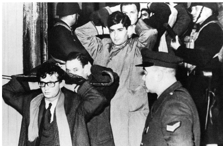
La noche del 29 de julio de 1966, el gobierno de facto del general Juan Carlos Onganía reprimió a profesores y estudiantes universitarios e intervino las universidades nacionales, a las que consideraba centros de difusión del comunismo.

Por otra parte, el Departamento de Estado estadounidense invoca fuertemente la democracia política, más como forma de contener ese potencial "amenazante" de la estabilidad de la región —ya sea el comunismo o las experiencias populistas— que como una pretensión genuina. En efecto, y a despecho de esa apelación, nadie conculca más fuertemente la posibilidad del ejercicio de la democracia política liberal que la propia polí-