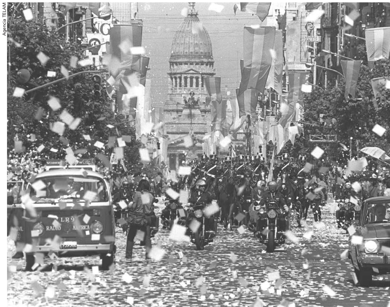
La Avenida de Mayo el día que Alfonsín asumió la presidencia de la Argentina, 10 de diciembre de 1983.

En las transiciones de dictaduras a democracias políticas producidas en América Latina en las décadas de 1980 y 1990, la principal característica fue la renuncia a transformaciones radicales. Según Norbert Lechner, la demanda de revolución en los años sesenta y setenta se transformó en demanda de democracia en los ochenta. Se puede coincidir o no con el argumento de Lechner, pero no puede dejar de constatar que, en efecto, esto ha ocurrido en las agendas política e intelectual. La historia reciente nos sitúa en una encrucijada que nos obliga a discutir la viabilidad de la democra-