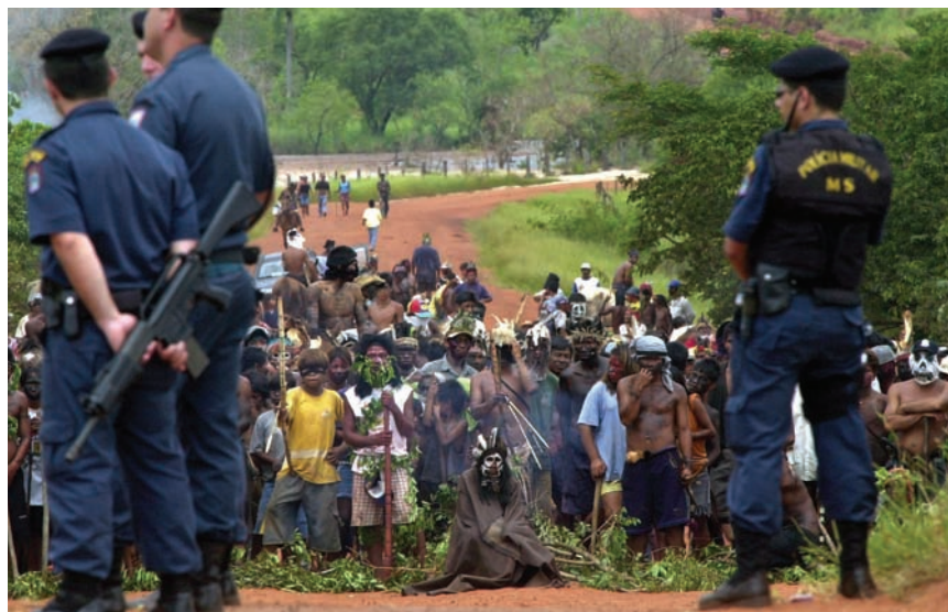
Ceiso Junior / AE

Los datos del bienio 2002-2003 son terribles: 18,5 % de la población latinoamericana es extremadamente pobre; el 11 % está subnutrida y, entre los niños menores de 5 años, el 7,9 % está desnutridos. La pobla-