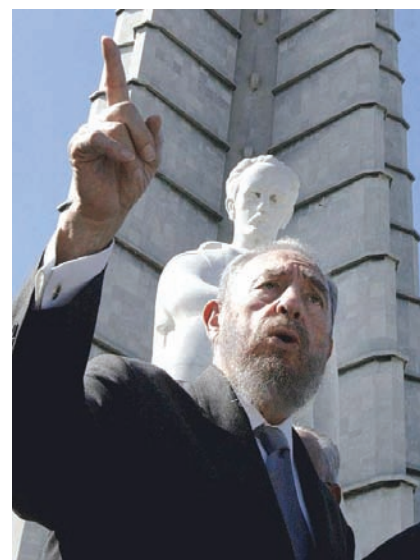
Ricardo Stuckert / ABR

La tarea de repensar la democracia es urgente, incluyendo su articulación con el proceso de globalización económica, social, política, cultural e ideológica neoliberal. La articulación entre Estado (mínimo) y grupos empresarios es una de las formas que adquiere ese proceso. Otra manifestación es la opción prioritaria del crecimiento económico por sobre la democracia, elección indicativa de un triunfo ideológico del neoliberalismo, que privilegia la primacía del mercado en la definición de los mecanismos de crecimiento económico, mas no de desarrollo económico-social, postergando la extensión y profundización de los derechos democráticos. El problema es, pues, el de la colisión entre intereses económicos y valores político-sociales democráticos. En sociedades con una historia de burguesías de rapiña, sin actores democráticos fuertes y con ciudadanos licuados, una política tal amenaza fuertemente el futuro inmediato de la democracia, aun cuando algunos procesos