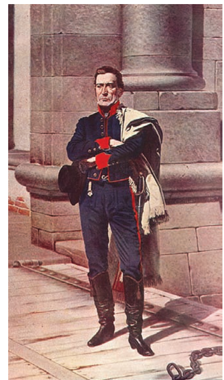
José Artigas en la Ciudadela, Montevideo, Uruguay, según la pintura de Juan Manuel Blanes de 1884.

Con todo, el liberalismo de la fase de ruptura del nexo colonial elabora algunas preceptivas que, aunque minoritarias y fugaces,