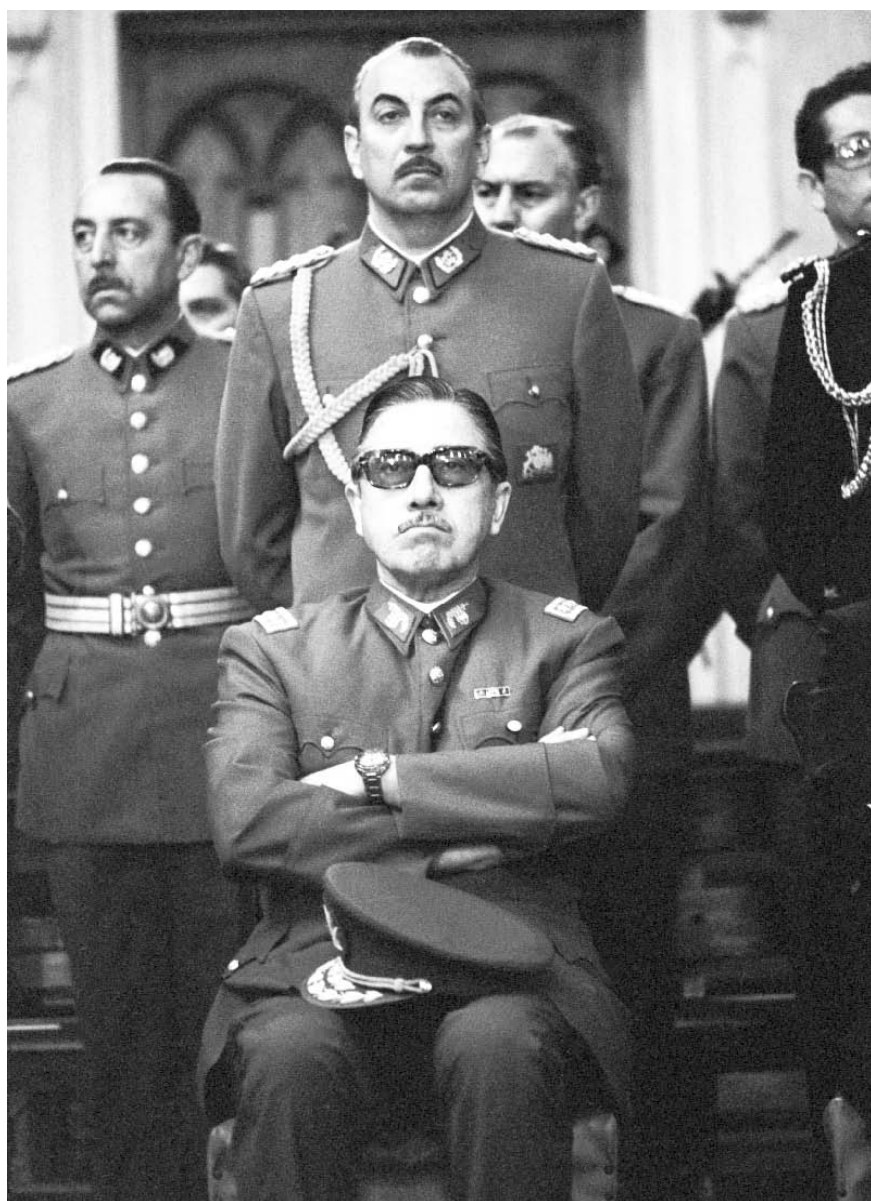
En 1973, el general Augusto Pinochet, con el apoyo de los Estados Unidos, derrocó el gobierno chileno del socialista Salvador Allende, quien se suicidó durante el bombardeo de la Moneda.

externos (internacionales). Simple porque el procedimiento general es una solución de negociaciones tomada en el vértice, por las direcciones de los partidos políticos, eventualmente de las organizaciones representativas de intereses (sean de masas, como los sindicatos obreros, o más restrictivas, pero también más poderosas, como las de la burguesía), y las conducciones militares. En tales salidas, las masas — pese a su importante papel en las luchas antidictatoriales— son marginadas. Es decir, la lógica de las transiciones es igual o similar, pero la historia de cada una de ellas es diferente e, incluso, específica.