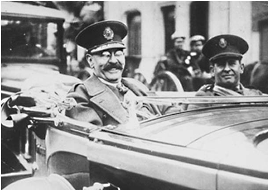
José Félix Uriburu derrocó a Hipólito Yrigoyen el 8 de septiembre de 1930 e inauguró la larga historia de gobiernos de facto en la Argentina.