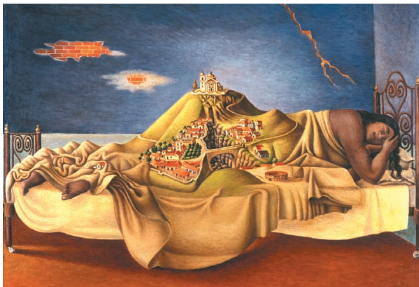
Gentileza Luisa Barrios

Mestizaje es una noción cuyo uso sugiere significados contrapuestos. Del lado "oficial" y del sentido común, el mestizaje es una ideología de fusión de las diferencias (biológicas y culturales). Del lado "crítico", remite a un proceso abierto de diferenciación constante donde no hay punto de fusión, ni crisol posible. Las naciones latinoamericanas edificaron sus ideologías nacionalistas sobre la primera noción de mestizaje, elevando las ideas y valores de lo mestizo –llámese criollo, cholo o ladino– a símbolos de sus nacionalidades. Bajo esta aparente democracia se encubren otras posibilidades identitarias, pero, sobre todo, se desconoce el proceso de diferenciación social y cultural que hace surgir "diferencias" impensadas. El punto clave de esta ideología es el establecimiento de una jerarquía entre los tipos de fusión deseables y los grados de esa fusión. Así, bajo la noción genérica de mestizo puede entrar el patrón criollo –criollo por ser americano–, el profesional liberal "gringo" –criollo por aclimatado o hijo de inmi-grantes–, el mestizo propiamente