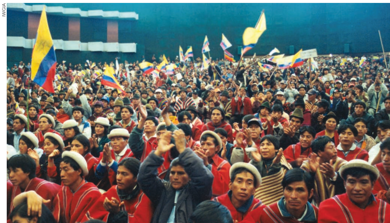
Reemergencia en tierras altas: organizaciones indígenas exigen la renuncia del presidente ecuatoriano Jamil Mahuad en el año 2000.

fomentó violentos procesos de "extracción" de riqueza y trabajo a través de empresas de colonización oficial o privada. En las fronteras, por su condición de tales, una vez más la "civilización" se antepuso como objetivo táctico a la "nacionalización", es decir, se privilegió la "humanización" de los "salvajes" sobre hacerlos "compatriotas". En esto sigue pesando el acendrado prejuicio acerca de los cazadores-recolectores que viven en ese hábitat y que suelen ser descritos como holgazanes, improductivos y, por ello, mismo "salvajes" en comparación con las "civilizaciones indias" agrícolas y la sociedad industrial. Entre los muchos ejemplos de traducción de estos prejuicios en muertes, cabe mencionar la desarticulación demográfica y cultural de los xavantes luego de la apertura de la ruta transamazónica en el Brasil del milagro setentista o la migración desde los sesenta de los indígenas sin tierra de la sierra peruana, quienes, en busca de "oportunidades de progreso", se emplean en las empresas extractivistas de la selva y terminan enfrentándose con los indígenas que las habitan.