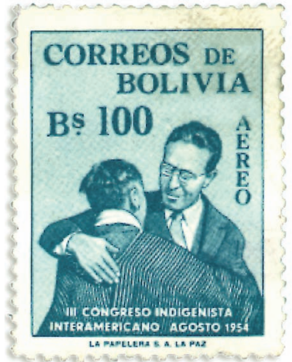
Agencia de Correos de Bolivia

¿Qué idea de nación conllevaba el indigenismo clásico? Con el objetivo de integrar a los indígenas, la nación era concebida como una comunidad aún en formación, por lo que debían subrayarse todos los rasgos que unificaban, descartando los que podían generar divergencias. En este modelo de nación los gobiernos fomentaban una sola lengua —el castellano o portugués—, una sola religión —la católica—, la idea de un territorio indiviso —la patria— y la noción de una única "raza" —la blanca o al menos el ideal racista del "blaqueamiento". Es tan cierto que la idea de nación ha sido la clave emancipadora del dominio colonial como