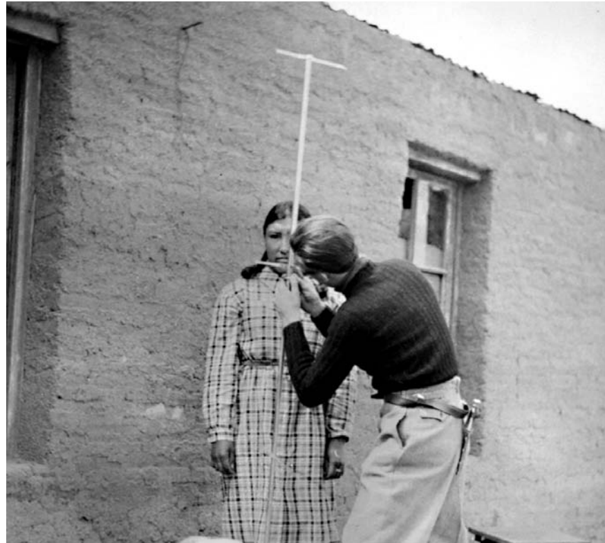
Museo Etnográfico / UBA

Entre los grupos en situación de subordinación dentro de una sociedad nacional, los pueblos indígenas u originarios –como también se autodenominan– son aquellos que se ven y son vistos como los descendientes de las agrupaciones que “estaban antes” de los procesos de conquista, colonización y nacionalización que desencadenó la expansión mundial de las naciones europeas. Indígena es toda persona que manifiesta descender de los pueblos y comunidades autóctonos que fueron vencidos y que hoy siguen sufriendo las consecuencias de esa derrota incesante. Ser indígena es tener algún tipo de conciencia de que la marginalidad y exclusión que afecta depende de que es autóctona, o sea, que sus orígenes culturales no se encuentran “afuera” de este continente ligados a los conquistadores y los inmigrantes. Pueblo indígena es una categoría político-cultural que remite a un conjunto de personas y grupos con capacidad de actuar y confrontar colectivamente sobre la base de intereses comunes, creencias y valores compartidos. En este sentido, es un error confundir pueblo indígena con “cultura indígena”, “comunidad indígena” y más aún con “raza indígena”, aunque estos términos aparezcan legitimando la acción de un pueblo indígena, del Estado o la sociedad. La relación de dominio que se establece entre las socie-