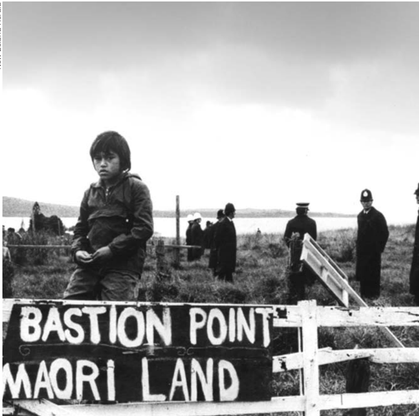
En todo el mundo los pueblos indígenas luchan por sus derechos, como los maoríes de Australia.

Por otra parte, pueblo indígena es una categoría jurídica de alcance mundial y aparece consagrada en documentos de la Organización Internacional del Trabajo y de las Naciones Unidas. Hay pueblos indígenas en todas las regiones del mundo donde se constata la lucha por los derechos por parte de poblaciones descendientes de pueblos autóctonos conquistados. Si en América Latina estos pueblos indígenas son los llamados indios, en Canadá se los conoce como