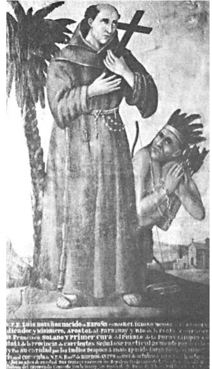
Siervos de Dios, amos de indios.

Los guaraníes que habitaban en las cuencas de los ríos Paraguay y Paraná fueron sometidos por los españoles a través de encomiendas, especialmente la llamada encomienda originaria por la que se otorgaba diez o más mujeres indias a un conquistador. Luego, los jesuitas, aprovechando el