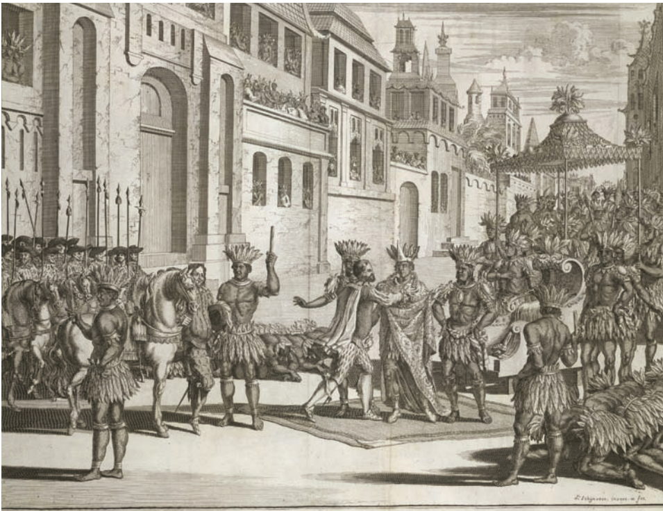
¿Moctezuma vasallo voluntario del rey de España? Grabado español del siglo XVIII.

En contraposición a estos modelos de incorporación se destacan los vínculos entablados con las sociedades que permanecieron en los márgenes, pero no ajenas al sistema colonial; vínculos que se dieron mediante guerras, comercio, alianzas políticas y movimientos demográficos. En esta situación se encontraban los llamados indios alzados, bravos o aucas. Entre ellos estaban los avá-guaraníes (chiriguano) y los guaycurúes (genérico que incluía a tobas, abipones, mocovíes, pilagá, entre otros) que habitaban el Gran Chaco; los mapuches, pampas y tehuelches de la Pampa, la Patagonia y la Araucanía; los chichimecas que vivían en el norte de Nueva España (México) o los chunchos de las selvas que bordeaban los virreinos del Perú y Nueva Granada. Eran todos ellos "indios de frontera", participantes en ese espacio de relaciones interétnicas que también incluía a mestizos, esclavos negros escapados y