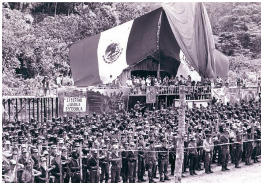
Indios y mexicanos, pero de otro modo. Formación del EZLN ante la bandera mexicana.

El derecho a identidad cultural supone una lucha por afirmarse y afirmar, contra los poderes vigentes, el valor positivo de las costumbres tradicionales y, en especial, las lenguas vernáculas, la espiritualidad y las visiones históricas indígenas. En el siglo XIX, cuando se le dio un sesgo antropológico al sentido de cultura, se pensaba que los indios "tenían" algo de cultura, pero no mucho. En el siglo XX, la antropología pensó que los indígenas constituían "culturas" diferentes, pero luego, por los procesos de colonización, "perdieron" esa diferencia cultural (se asimilaron y aculturaron como "campesinos", "villeros", etc.). Hoy la antropología y las ciencias sociales piensan que la cultura es un proceso de creación y recreación de formas de vida. Los pueblos indígenas se muestran como hacedores de cultura y, más precisamente, de de su identidad a partir de lo que consideran su cultura. Las discusiones en torno a los programas de interculturalidad y bilingüismo en la educación, los proyectos de escrituración de lenguas orales, los talle-