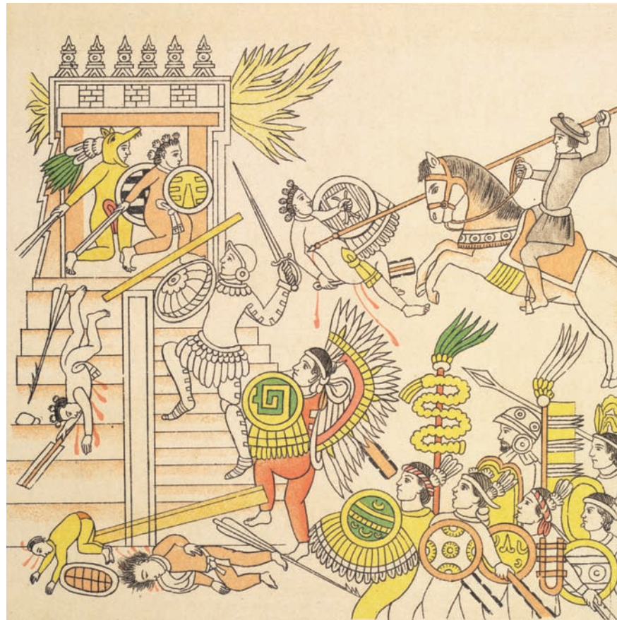
Guerra: pintores aztecas del siglo XVI representan el ataque al templo de Tenochtitlán, México (Códice florentino).

Abya Yala —término de los indios kuna utilizado hoy por el movimiento indígena