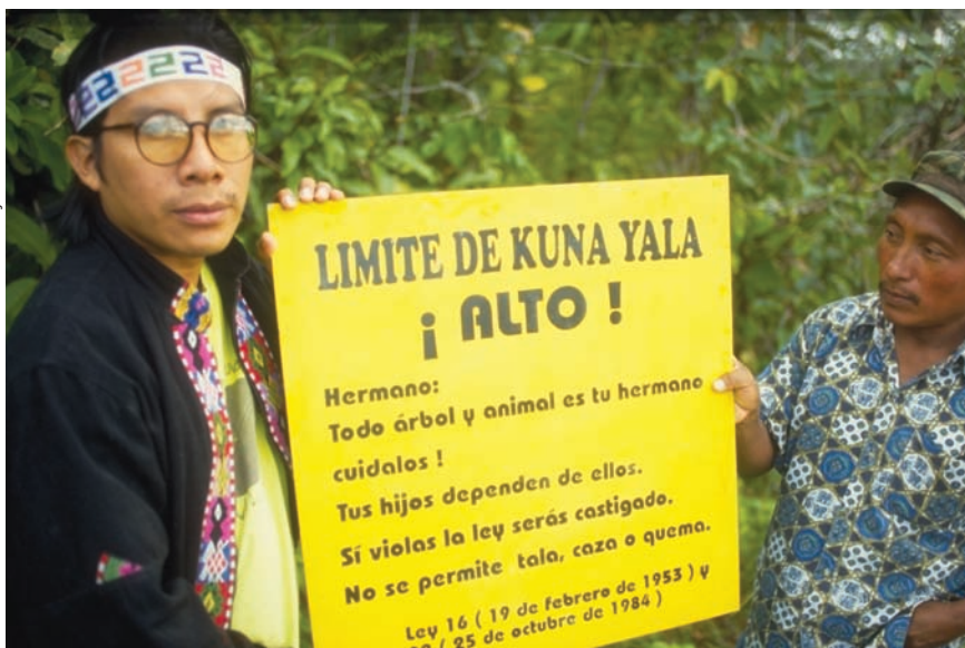
No bastan las leyes. En Panamá, los kuna hacen cumplir la demarcación de sus territorios.

pues, que la determinación de "quién es quién" es, ante todo, un hecho político de la reemergencia en la que están involucrados tanto indígenas como no indígenas, ya que de la identificación de los sujetos y de su peso demográfico dependen la asignación de recursos, el diseño de políticas públicas y las estrategias de legitimación de los propios indígenas. La lucha por el reconocimiento legal del principio de autoidentificación —considerado un derecho humano— sólo se entiende en el contexto de fortalecimiento de la conciencia indígena que deja atrás el estigma que antes obligaba a esconder la indianidad.