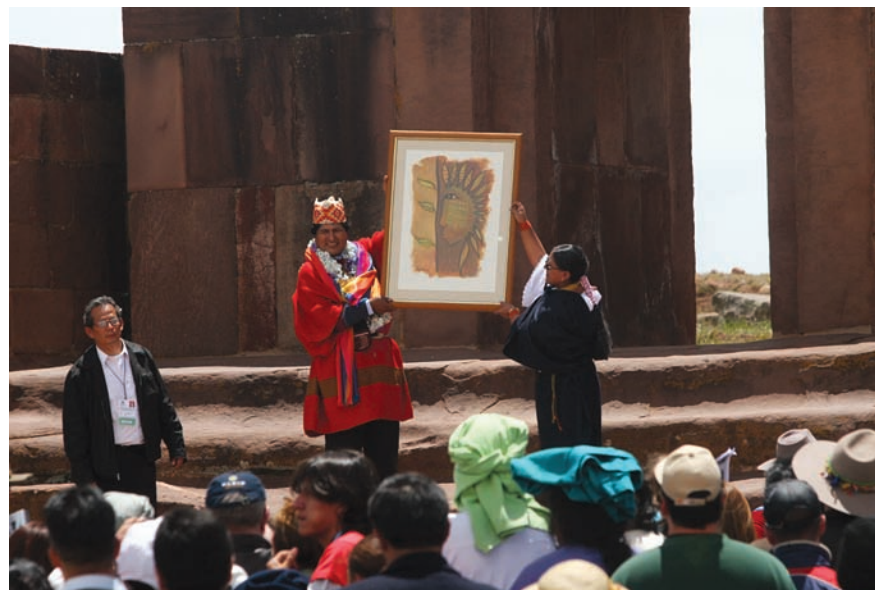
¿El gobierno boliviano en manos de un indio? El presidente Evo Morales es coronado "líder supremo" (Apu Mallku) el 21 de enero de 2006.

El reencantamiento de la memoria de esas épocas que se atisba en muchas de las demandas indígenas tiene, no obstante, sus límites. En primer lugar, como es evidente, hoy el reclamo se sostiene en la lucha por la autonomía basada en la identidad "propia", antes negada por el discurso del "campesino indígena" o el "indio nacional" del indigenismo asimilacionista. En segundo lugar, la actual reemergencia se distingue por poner en juego otros orígenes. En efecto, los procesos de nacionalización de indios antes referidos no se dieron del mismo modo a lo largo de América Latina. En muchas zonas coincidentes con las fronteras internas de los Estados nacionales, los indígenas conservaron, en los hechos, una mayor autonomía relativa, a pesar de que en esas áreas el Estado