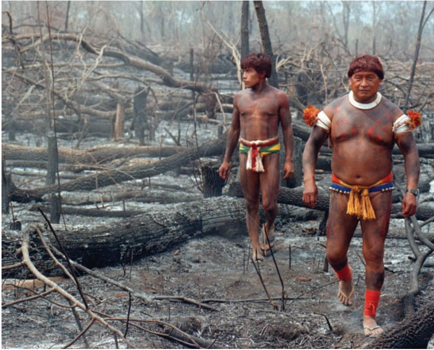
Indígenas deforestados (Brasil).

nes de la reemergencia fue el proceso de reforma del Estado. Hay que entender por ella un momento más del proceso formativo del Estado en América Latina en el que se redefinen los ejes de la dominación social y las coordenadas de gobierno en el contexto de una internacionalización acelerada de mercados, regímenes jurídicos y movimientos de protesta. Así, desde los años noventa puede observarse la paradoja de una "democracia neoliberal" que, mientras por un lado incentiva proyectos de participación, descentralización, autonomía, tolerancia y pluralismo, por otro "ajusta" al máximo la distribución de recursos sociales y económicos en la población. La retórica del Estado "eficiente" se traduce en una creciente marginación de los indígenas como ciudadanos y un veloz deterioro de sus condiciones de reproducción material y cultural. En efecto, han aumentado los ritmos de concentración latifundista en manos privadas (nacionales y extranjeras), pasando por encima de las tierras indígenas (por lo general ya transformadas en minifundios o con títulos precarios) y generando la expulsión de grandes números de campesinos que van a las ciudades, al extranjero o quedan como población "sin tierra". Esto, a su vez, provoca la baja de salarios y a la expansión del hambre en el